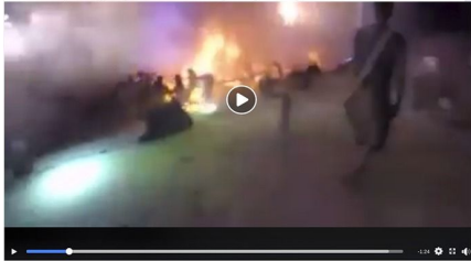
Konser di Taipei, 500 gay terbakar

Video 500 Gay Kulitnya Mengelupas Pasca Pesta Pelanginya Terbakar Ulli beberapa waktu yang lalu mempertanyakan azab Allah kalau memang ditimpakan pada kaum Sodom karena prilaku perkawinan sejenis kenapa tidak ditimpakan pada para pelaku LGBT masa kini? Apakah itu bukti bahwa Tuhan tidak pernah serius menghukum para gay? Apakah itu hanya pemikiran Ulli semata yang semakin "gegar otak"? Aneh jika keimanan Ulli masih belum terganggu dengan adanya peristiwa di Taiwan ini berkaitan dengan Pesta Pelangi kaum gay dan lesbi. Apakah azab Tuhan sudah tiba? Saksikan videonya di bagian akhir halaman ini: Euforia pernikahan semacam untuk sekumpulan "LGBT" masalah begitu santer terdengar sampai saat ini. Serta hal semacam itu yaitu efek dari legalisasi pernikahan semacam yang saat ini disadari negara Amerika Serikat lewat pengadilannya, jadi keceriaan yang sendiri untuk mereka yang telah lama inginkan pernikahan semacam memiliki payung hukum. Dan Pesta Pelangi Gay juga dilaksanakan di Taiwan, tetapi pesta itu berbuntut malapetaka. Ulli yang merayakan serta yang menemani Pesta Pelangi yang awal mulanya pernah "kecewa" itu mendadak terbakar jadi satu malapetaka. Api mendadak menyebar serta membakar beberapa ratus orang itu. Yang mungkin persebaran api disangka akibat terpacak partikel metalik warna-warni "simbol" Pesta Pelangi. Serta di ketahui, kalau Pesta Pelangi adalah satu diantara pesta yang diadakan oleh golongan Gay.